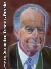
Carlos Gurméndez. Obra de Miguel Fernández Fernández

18.º Curso de Pensamento Carlos Gurméndez Ferrol, 8, 9 e 10 de xullo de 2015