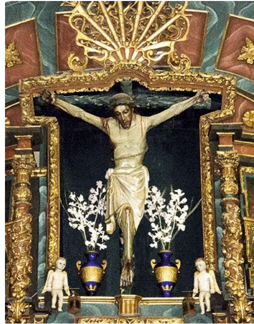
Cristo da Cadea. Santa María de Neda

Son moitos os Cristos galegos dos que se conta que chegaron polo mar e que hoxe adobían os altares das igrexas galegas de lugares da costa, onde ostentan o padroado dos mareantes e son obxecto da devoción popular. Ademais do Cristo da Cadea , en Santa María de Neda, temos o Santo Cristo en Santa María de Fisterra; o Cristo da Agonía en San Pedro de Muros; o Cristo da Victoria , na Igrexa Colexiata de de Vigo; o Cristo do Consolo , en Cangas do Morrazo; o Cristo das Augas en A Guarda; e o Santo Cristo , na Catedral de San Martiño de Ourense, entre outros.