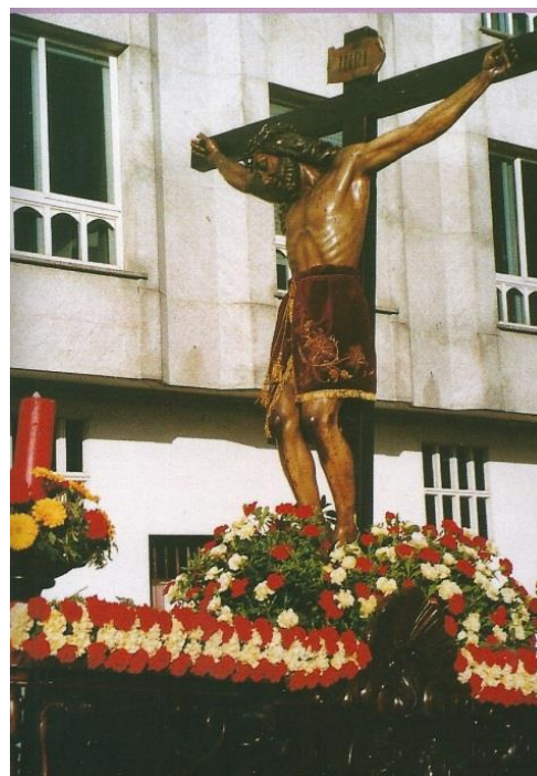
O Cristo dos Navegantes (imaxe vella) O Cristo dos Navegantes (nova talla)

Trátase dunha obra de reputada antigüidade, procedente da devandita igrexa de San Xulián. Na igrexa de Nosa Señora do Socorro, a talla de Cristo foi colocada no altar lateral dereito do presbiterio. Trátase dunha obra anónima do século XVII, unha escultura de sequidade e dureza formal, cunha anatomía marcada e sen a menor compracencia estética. A imaxe, de boas proporcións, ten as características da arte barroca popular. Sobre unha cruz en forma de tau, amosa un Cristo sufrinte de tres cravos, representado como morto, coas máis entreabertas, testa coroada de espiñas e caída á dereita, e co pano de pureza de abondosos pregos atado ao mesmo lado.