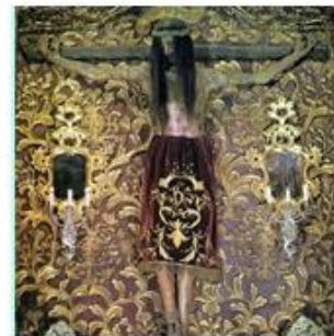
Os Cristos do Mar galegos Fisterra, Vigo, Cangas, Ourense